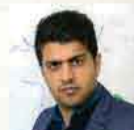
استاد پور غلام (پرستاری)