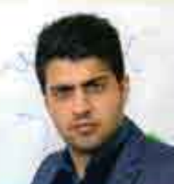
استاد پورغلام (پرستاری)